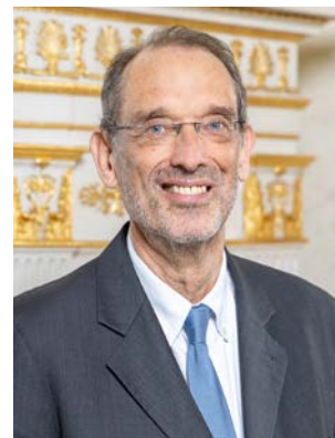
Bundesminister Univ.-Prof. Dr. Heinz Faßmann